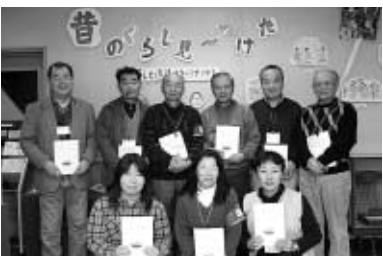
歴史資料収蔵センターに来てください。文化財ボランティアさんだのホームページもあります( http://www.kippydenet/mypage/burbora )。