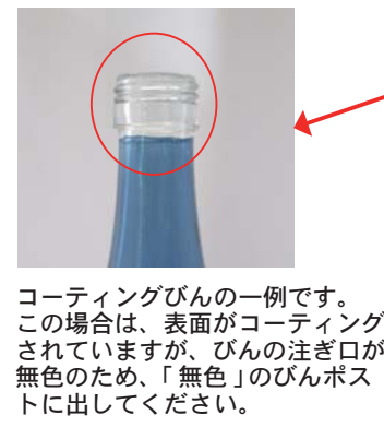
コーティングびんの一例です。この場合は、表面がコーティングされていますが、びんの注ぎ口が無色のため、「無色」のびんポストに出してください。

れていることがあるので、分け方のポイントをお知らせします。色については、最近増えてきているカラフルなラッピング加工がされているびんは、びんの口(注ぎ口)の色でびん自体の色がわかります。びん本体がどのような色でも口が無色なら無色のびんポストに出してください。(下記画像を参照) 色が淡く、何色かわからないものは、光りに透かして見分けてください。また、びんポストへ出すものであれば割れていても処理します。びんは、レジ袋に入れずに、びんのみを出してください。 ガラス板、ガラスコップ、陶磁器、電球は、びんポストに入れないで燃やさないごみに出してください。取り残しをした各びんポストには、処理できない品物をシールなどでお知らせ