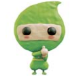
臨時福祉給付金キャラクター

※申請先は、平成 27 年 1 月 1 日に住民登録をしている市町村です。「カクニンジャ」