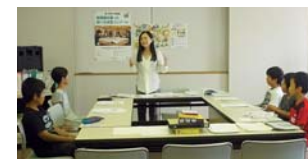
図書館での「調べる学習」

説明を行います。子どもたち同士で助け合ったり、楽しみながら深く調べます。本を使って、知らないことがどんどん