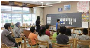
オープンスクールの様子

子どもたちに本を使った調べ方の基本やコツを伝えます。まず、子どもたちは本の分類を学び、次に子ども向けの百科辞典などから調べるヒントを見つけることで、図鑑やより詳しい本へと調べを進めます。また、資料の著作権を守ることや、インターネットからの資料の引用の仕方についても、わかりやすく