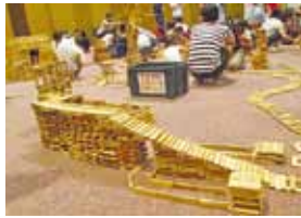
総合福祉保健センター 合同フォーラム

⑤親子活動や音楽鑑賞会、健康作り体操、整理収納講座などの体験学習 事例)野外活動センターでの親子のふれあい。