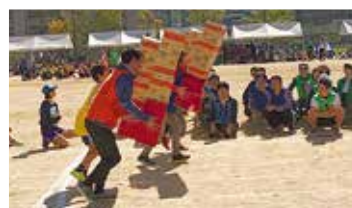
▲ウッディタウン運動会の様子

また、10月28日には「第27回ウッディタウン運動会」が開催されました。けやき台中学校で開催された運動会は、約1,000人の参加者が集まり、さわやかな秋晴れの下、各地区対抗でさまざまな競技が繰り広げられました。主催はウッディタウン地区体育振興会で、各地区の体育振興会の皆さんの協力により、参加者はスポーツで汗を流し、充実した1日となりました。他にも、「ソフトボール大会」、「ドッジボール大会」など、ウッディタウン全体でスポーツ活動が盛んに行われています。