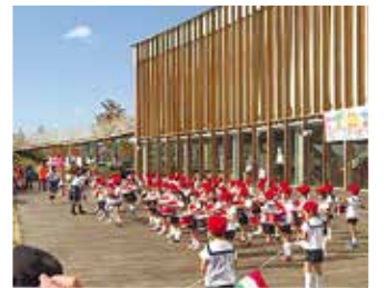
▲市民センターまつりの様子

けやき台・すずかけ台・あかしあ台・ゆりのき台の4つの地区からなるウッディタウンは、人口約35,700人で市内で最も人口が多い地域です。各地区には自治会・まちづくり協議会が1つずつあります。他にもさまざまな地域団体があり、主に地区単位で活動を行っています。そんな中、ウッディタウン全体での活動があるのをご存知でしょうか。今回は4つの地区が連携した活動をご紹介します。