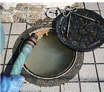
【①マスの中に汚水が溜まっている】

①マスの中に汚水が溜まっている場合 右上図中 B の公共下水道のつまりが原因です。三田市に連絡してください。