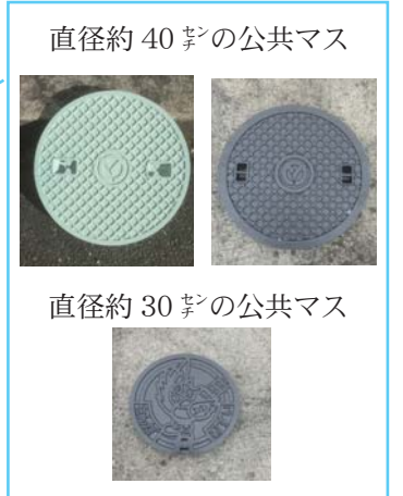
直径約 40 ㍍の公共マス