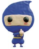
臨時福祉給付金 キャラクター 「カクニンジャ」

26 年 4 月からの消費税率引き上げによる影響を緩和するため、暫定的・臨時的な措置として支給する「28 年度臨時福祉給付金」の申請受付期間などが決まりましたのでお知らせします。