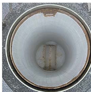
【②マスの中に汚水が溜まっていない】