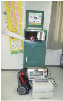
上の写真は、間違っ た出し方の例です。

市内では小型家電の回収ボックスを市内協力店舗 6 力所に設置し、パソコンをはじめ、小型家電から出る有価金属を回収、リサイクルしています。年々回収量も増え、資源化も進んでいますが、その一方でトラブルも発生しております。小型家電回収ボックスの中に、蛍光灯、プリンター、電子レンジなどの指定回収品以外の物を持ち込まれる市民の方が多く、お店と来店する人に大変ご迷惑をおかけしています。小型家電の回収ボックスについては、三田市が店舗にお願いして設置していただいていますので、小型家電回収による事故やケガなどにつながる恐れがある場合は、回収ボックスを撤去しなければなりません。持ち込まれる前に指定回収品かどうか確認をお願いします。小型家電回収のことでわからないことがあれば、クリーンセンターまでお問い合わせください。